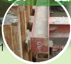
キャンバー使用例