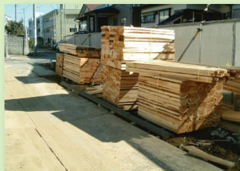
木矢板の納入状況例