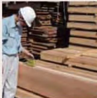
[格付け・品質管理の体制]